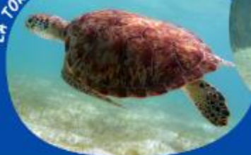
LA TORTUE VERTE SUR L'HERBIER