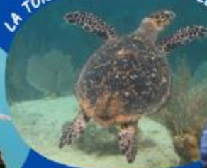
LA TORTUE IMBRIQUÉE SUR LE RÉCIF