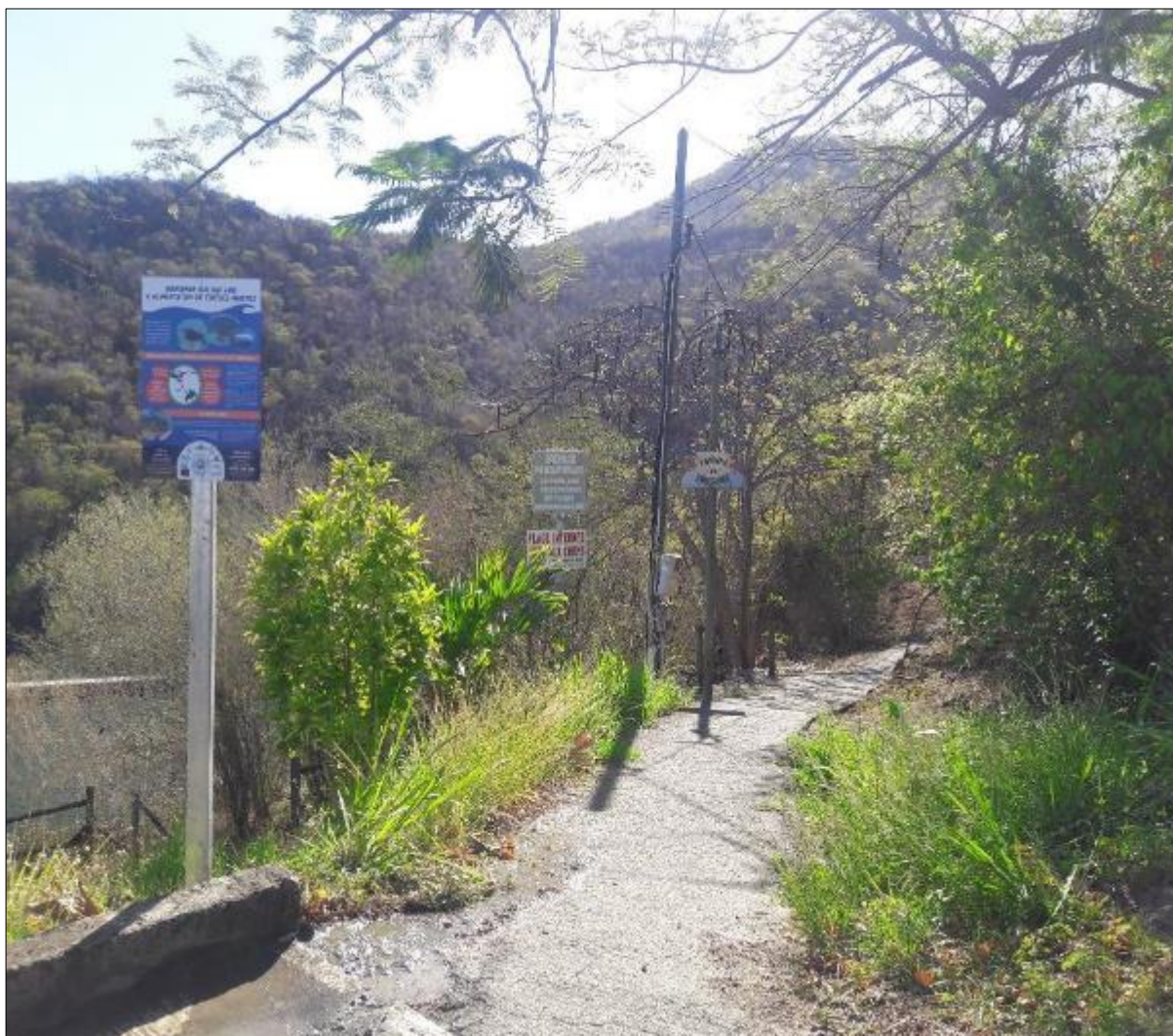
Le panneau posé à l'entrée de l'anse Noire