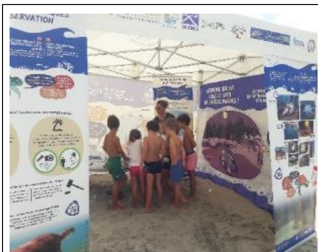
Animation au bourg des Anses d'Arlet