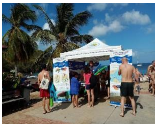
Animation à l'Anse Dufour