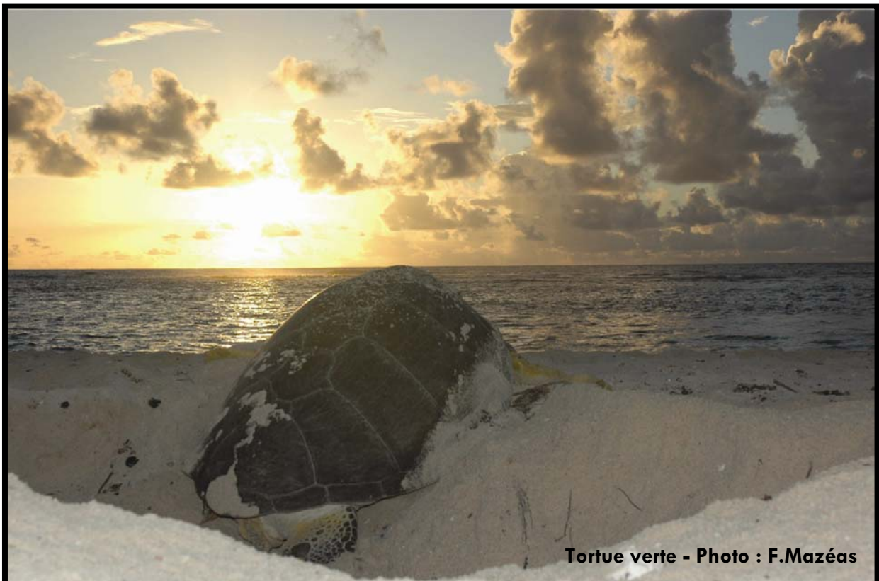
Tortue verte

Biologie Cycle de vie Ecologie et habitats Espèces